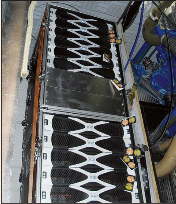
Rack com os amplificadores Studio R X12

Dezoito amplificadores Studio R, modelo X12, com 11 mil watts RMS cada em 2 ohms, além de quatro X8 com 8 mil watts RMS em 2 ohms e quatro XD de 3.600 watts RMS em 2 ohms nas vias de graves, médios e agudos fazem o som do trio elétrico usado por Claudia Leitte. A Série X foi a escolha ideal para o trio não apenas por usar os amplificadores que atualmente concentram a maior quantidade de potência da forma mais leve e compacta possível, mas também por serem hoje os modelos mais eficientes do mercado nacional, o que significa menor consumo de energia e emissão de calor, algo fundamental para um projeto tão audacioso e potente como este.