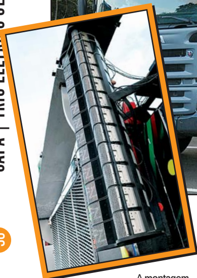
A montagem do trio (no alto), que inclui passarelas laterais e elevador. No detalhe, uma coluna com algumas das 150 caixas do projeto

“Robério me falou de um trio totalmente digital. Mas o termo digital não seria usado de uma forma vaga, e sim para definir um conceito inteiramente novo”, ressalta Fábio.